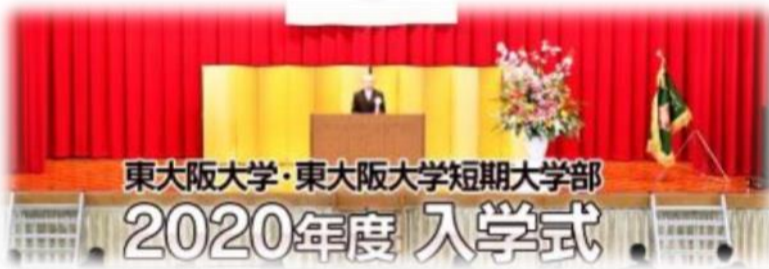
東大阪大学・東大阪大学短期大学部入学式(4/2)

また、入学式につきましては「東大阪大学附属幼稚園」「東大阪大学敬愛高等学校」の入学式を延期(中止)するとともに、「東大阪大学・同短期大学部(4/2)」「東大阪大学柏原高等学校(4/7)」「おぎまも」では、式の簡素