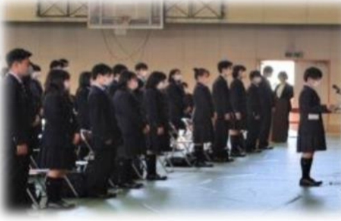
東大阪大学敬愛高等学校入学式(5/11)

化や式参列者の絞り込み、換気や除菌の徹底等、感染防止に向けた対応を徹底することで実施いたしました。