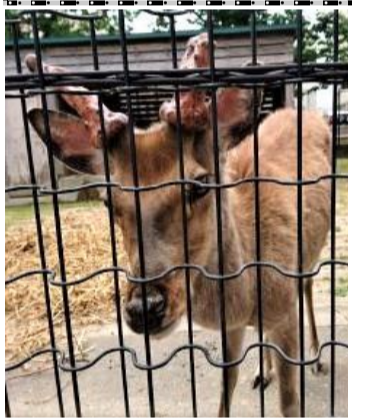
学園のシンボルの鹿(5/18日撮影)

二〇二〇年(令和二年)五月二十五日発行 発行元(発行責任者) 学校法人村上学園 法人事務局 参事(広報担当) 寺川 誠 東大阪市西堤学園町三二一 電話 〇六六七八一二四四四 URL https://www.murakamigakuen.jp/