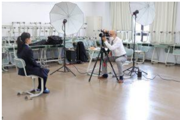
個人写真撮影の様子(5/12)