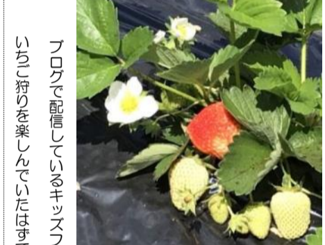
ブログで配信しているキッズファームの様子(いちご狩りを楽しんでいたはずでしたが……)

☆「体操、ダンス喜んでやっています」☆「手遊び楽しかったです」☆「幼稚園に行きたくなるようなこと、ブログを通じて教えてください」☆「お弁当包み、動画を見ながら練習しています」☆「ブログを見て親子で楽しい時間を過ごしています」☆「担任紹介、嬉しそうに見ていました」☆「幼稚園からのブログを見ました」☆「先生方の出演待っています」☆「教材を送ってもらって、幼稚園の先生に早く会いたくなつた」等