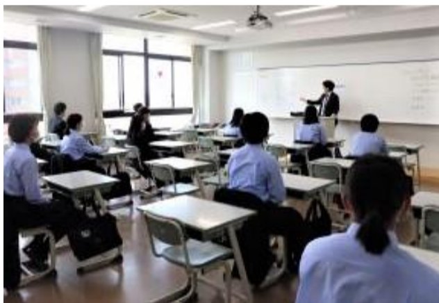
教室などの消毒やマスク着用などの感染症対策を行い、1年生が午前・午後に分かれ登校しました。クラス全員と顔合わせはできませんでしたが、担任の先生から校則や学校生活についての話を真剣に聞き、個人写真の撮影を行いました。約2時間ではありましたが、初めて学校で過ごすことができました。(HPより)