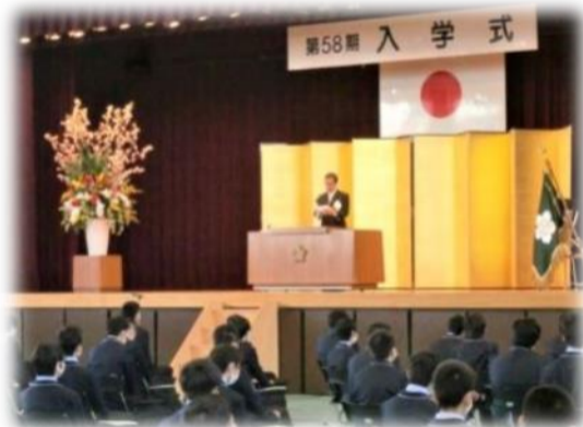
↑ 上：東大阪大学柏原高等学校 第58期入学式(4/7) ⇐ 下：入学式終了後の様子 (桜が咲き誇っています)